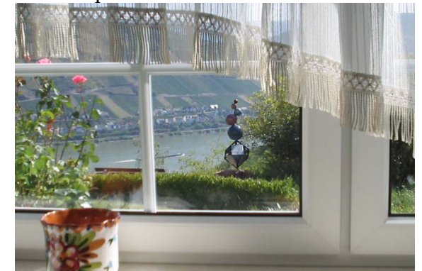
Vue sur le Rhin de la chambre de séjour

Vacances pour 2 à 4 personnes près de Bacharach sur les collines de la fascinante région de la vallée moyenne du Rhin, inscrit dans la liste du patrimoine culturel mondial de l'UNESCO : Appartement à 2 chambres avec cuisine et bain, entrée séparée et une vue directe sur le Rhin.