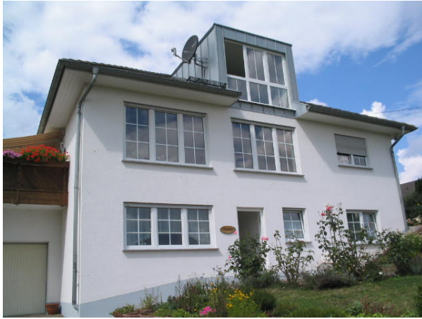
Maison avec l'entrée à l'appartement