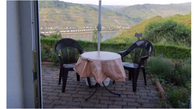
Perspective de terrasse

Vacances pour 2 à 4 personnes près de Bacharach sur les collines de la fascinante région de la vallée moyenne du Rhin, inscrit dans la liste du patrimoine culturel mondial de l'UNESCO : Appartement à 2 chambres avec cuisine et bain, entrée séparée et une vue directe sur le Rhin.