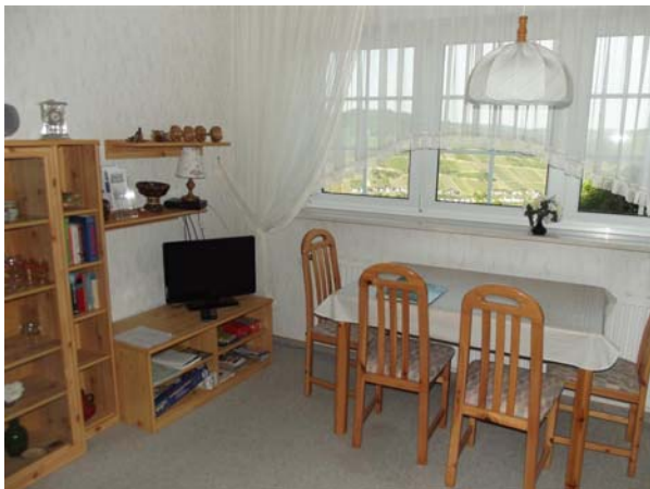
Vue partielle de la salle de séjour

Les linge de lit, des serviettes, internet, téléphone et frais accessoires sont incluses.