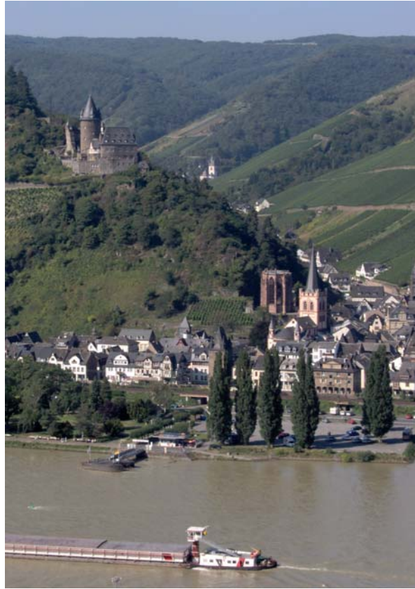
Vue de Bacharach de l'autre rivage du Rhin